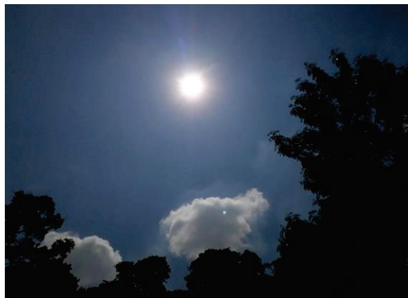
Sesiones sobre AMIGOS. Autor: Carolina Grueso