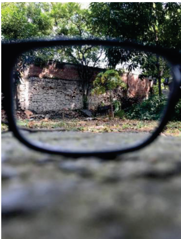
Sesiones sobre el YO. Autor: Camilo Jaramillo

A continuación, una muestra de fotografías obtenidas de algunos de los participantes (Ver Tabla 1) donde se evidencia el logro de los objetivos y la configuración de formatos metodológicos que permitan construcción de conocimiento a partir de las artes visuales como químico para que las personas puedan sentirse libres, auténticas y sinceras. Son una herramienta de catarsis para encontrarse y entenderse en el mundo.