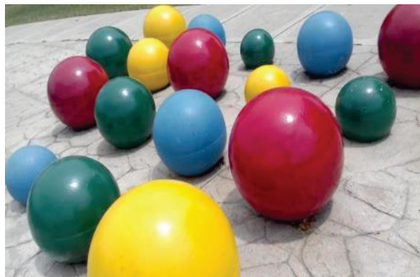
Sesiones sobre la FAMILIA. Autor: Camilo Sarria