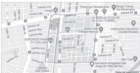
Figura 1. Ubicación barrio la independencia en Cali

Como punto central y de encuentro en este barrio, se determinó a la biblioteca pública comunitaria El Jardín, abierta a todos los agentes culturales del sector para que puedan desarrollar proyectos culturales en beneficio de la población cercana, dado que desde el 2014 dentro de la estrategia de la Presidencia de la República y el Ministerio de Tecnologías de la Información y las Comunicaciones (MINTIC) en el marco del Plan Vive Digital, se ejecutó el proceso de instalación de un Punto Vive Digital para acceso público a las tecnologías de la información y la comunicación.