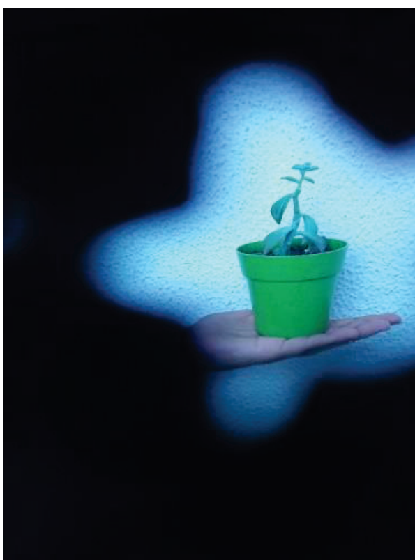
Sesiones sobre TRABAJO. Autor: Yessica Olmedo

Tabla 1 Evidencia de algunos proyectos obtenidos